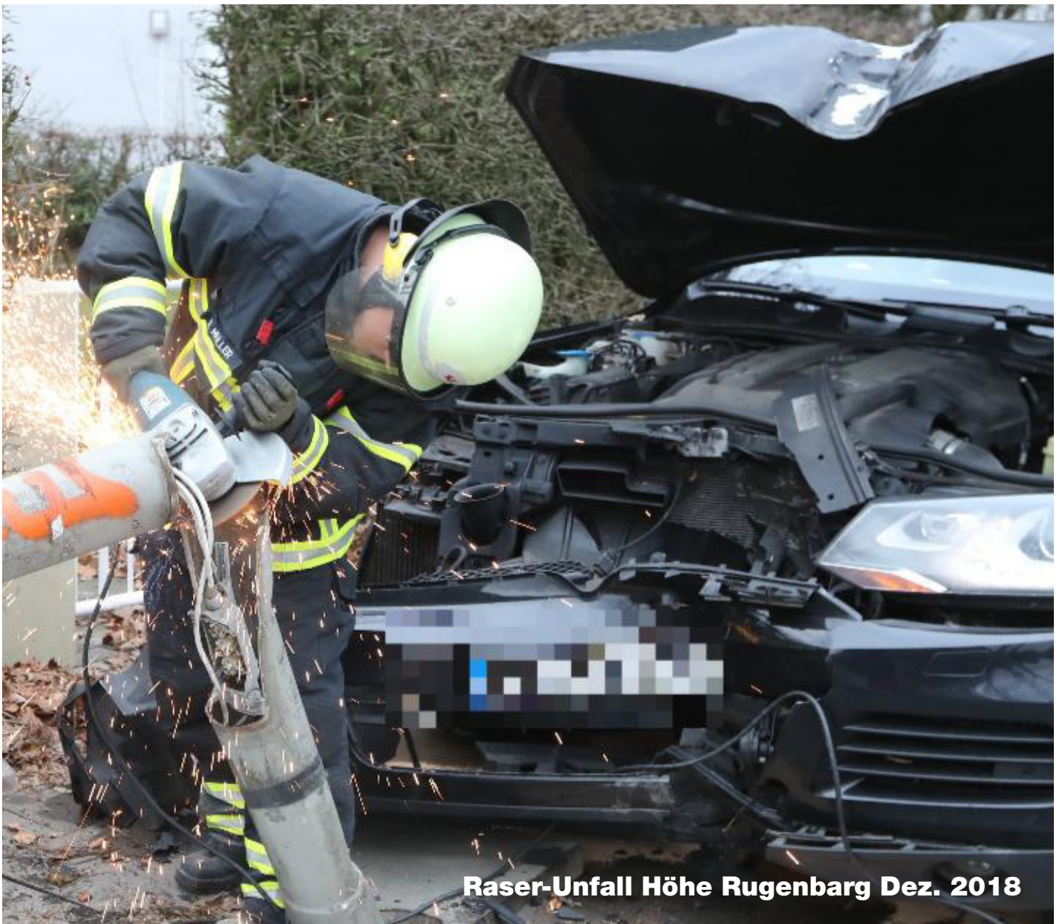
Raser-Unfall Höhe Rugenborg Dez. 2018