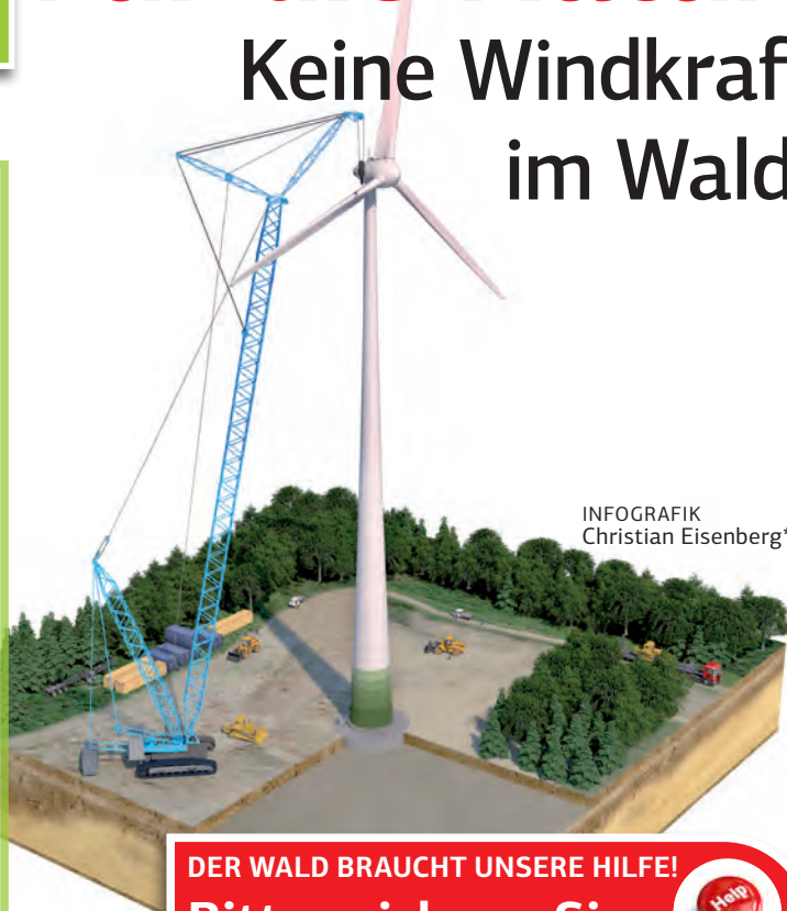
INFOGRAFIK Christian Eisenberg*